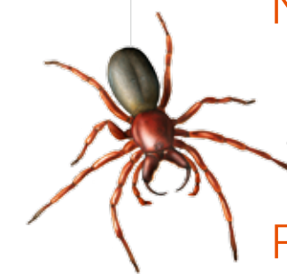
L'araignée ingénieuse p. 85