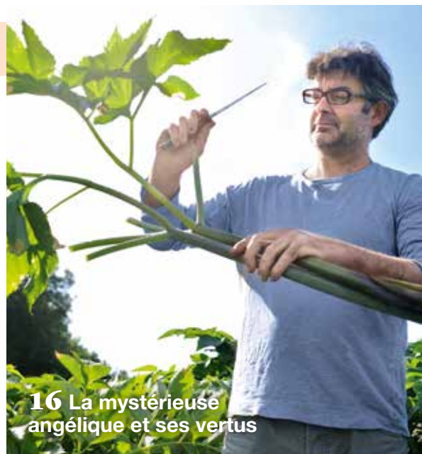
16 La mystérieuse angélique et ses vertus