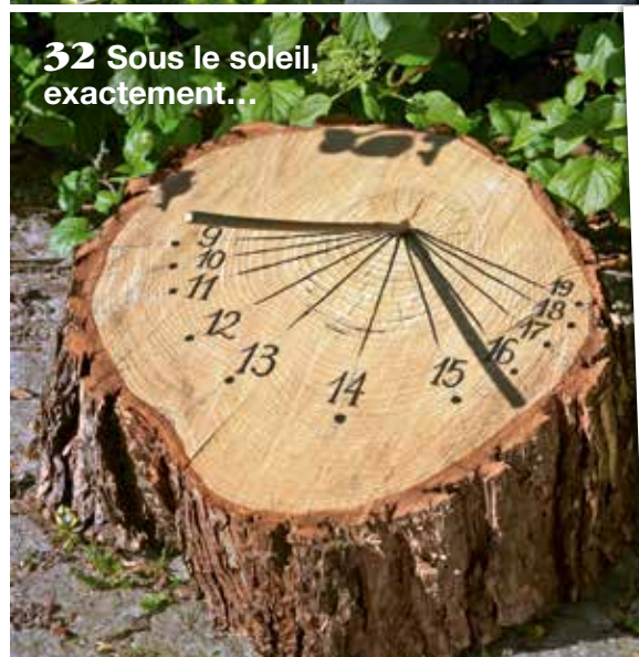
32 Sous le soleil, exactement...