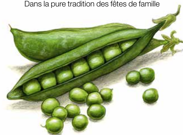
Le petit pois p. 44