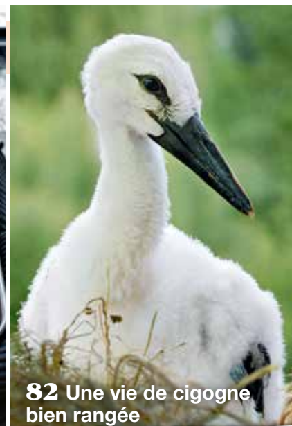
82 Une vie de cigogne bien rangée