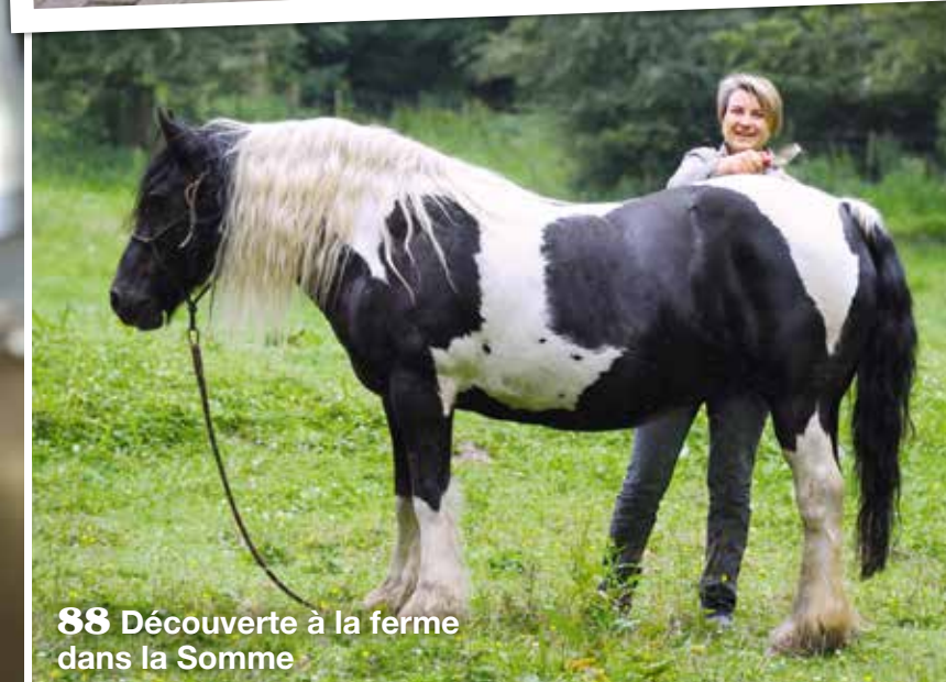
88 Découverte à la ferme dans la Somme