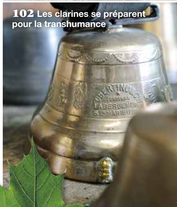
102 Les clarines se préparent pour la transhumance