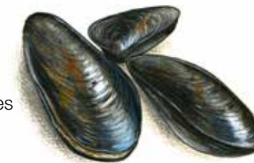
La mouclade charentaise p. 52