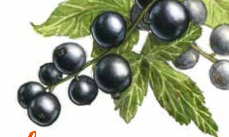
Le cassis p. 46