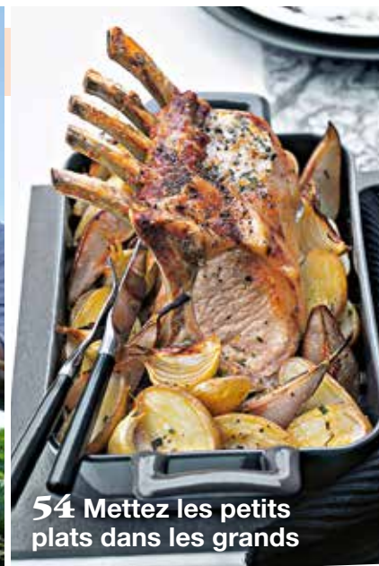
54 Mettez les petits plats dans les grands