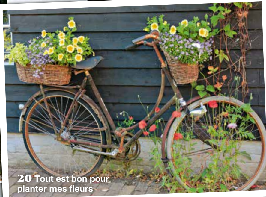
20 Tout est bon pour planter mes fleurs